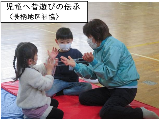
児童へ昔遊びの伝承 〈長柄地区社協〉