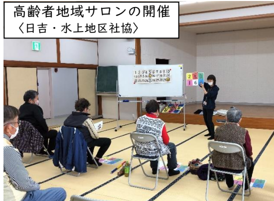
高齢者地域サロンの開催 〈日吉・水上地区社協〉